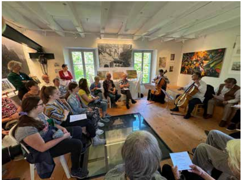
Kleinkunst im Eventraum der Bergstation: «Kunst auf dem Sonnenberg»

Mit zwei neuen Bähnlimanne konnte der Personalbestand leicht erhöht werden. Das ist nötig, denn die Verlängerung der Saison (Wochenendbetrieb) und Sondereinsätze mit Nachtfahrten fordern uns auch in diesem Bereich heraus. Die Kontakte sind aber vielver-