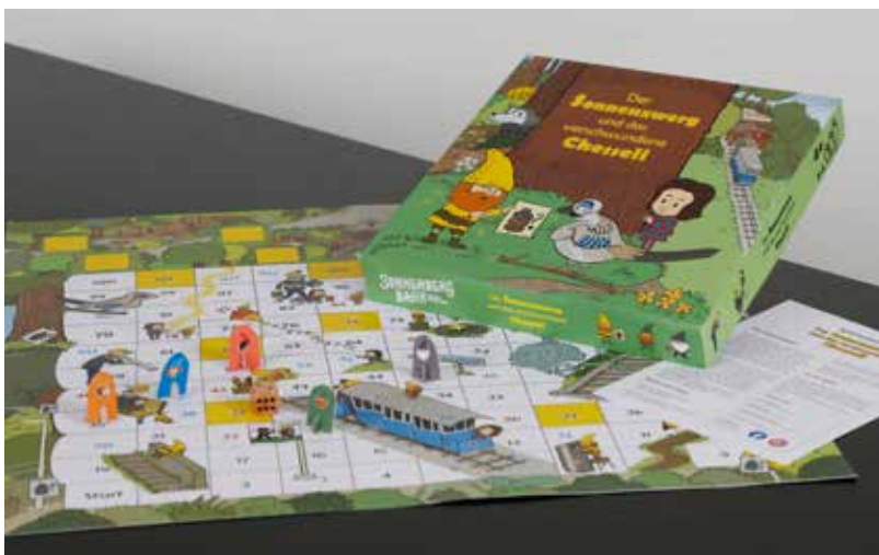
Das Brettspiel mit dem Sonnenzwerg: Würfelspiel und Memory vereint.