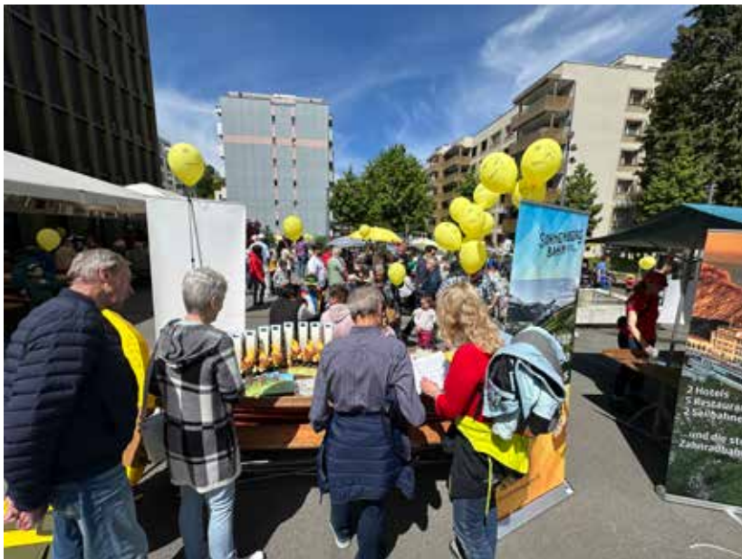
Die Sonnenbergbahn am Bahnenfest der Stadt Kriens auf dem Stadtplatz.