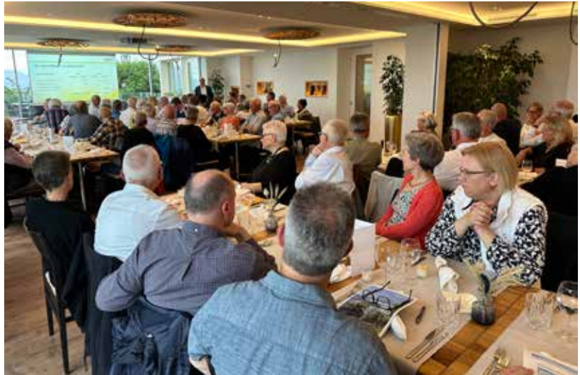
Die Generalversammlung der Sonnenbergbahn AG war auch 2024 gut besucht.

Auch im Jahr 2024 erfreute sich die Generalversammlung der Sonnenbergbahn grosser Beliebtheit. Der Austausch unter Aktionärinnen und Aktionären ist inzwischen zu einer schönen Tradition im Sommer geworden. Der Verwaltungsrat freut sich deshalb über die stets grosse Zahl an Teilnehmenden. Die GV 2024 stand im Zeichen des bevorstehenden Starts der umfassenden Sanierungsarbeiten. Die Teilnehmenden liessen sich über das geplante Gesamtpaket der Sanierung informieren. Die vor der GV vorgesehene Besichtigung des Eventraumes fiel wegen der Bauarbeiten für das B-Sides festival aus. Wir sorgen in diesem Jahr für Realersatz und öffnen den Raum vor der GV.